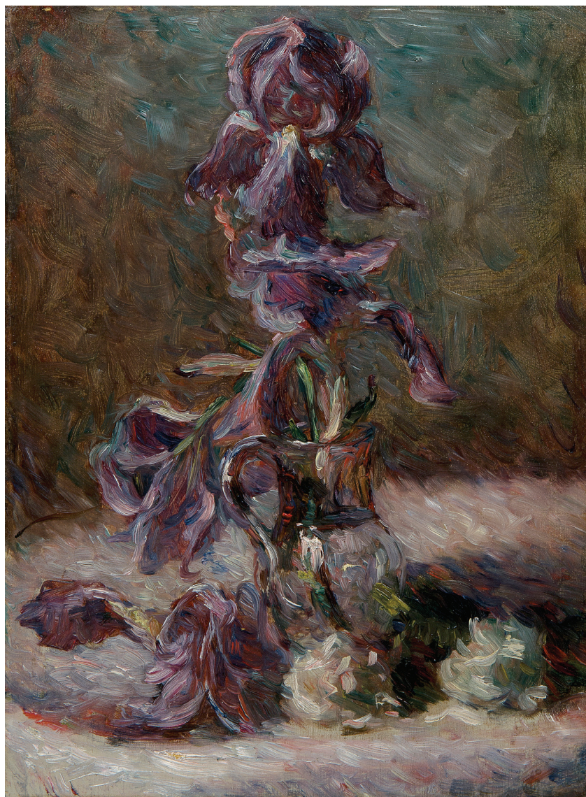
Iris in a Vase, Marie Bracquemond, 1886

Et toujours la main d'Ava dans la mienne, je levai les yeux vers l'imposte, là-haut, sur le toit de l'auditorium. Près du bord du soleil, je vis une tache sombre traverser le ciel. Je plissai les yeux pour mieux distinguer ce que c'était. Ce n'était pas un oiseau. Ce n'était pas un avion. C'était une relique de ce ciel autrefois si peuplé.