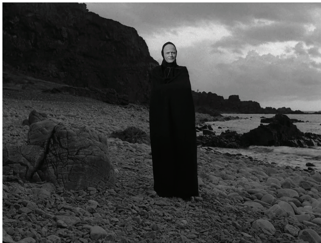
Le septième sceau, Ingmar Bergman

On a frappé à la porte. On m'appelait. Il était temps.