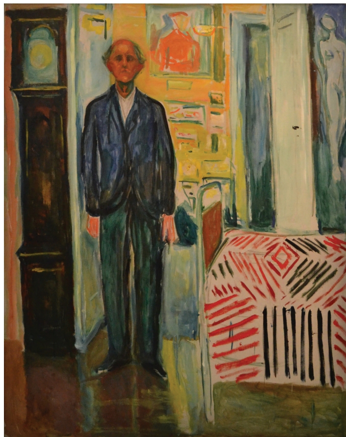
Self-Portrait. Between the Clock and the Bed, Edvard Munch

Je me suis tourné vers le grand fauteuil en cuir dans le coin de la pièce. J'ai cherché un pli sur les coussins, une trace sur le dossier, n'importe quoi qui puisse me convaincre qu'il avait bien été là. Je pouvais jurer qu'il avait été là. Nous nous sommes assis au bord du lit pendant un moment. Ava a essuyé mes larmes, puis elle est repartie pour me laisser un moment seul, avant notre départ. Quand je suis enfin descendu, j'espérais qu'elle ne verrait pas que j'étais bouleversé. Que je pleurais.