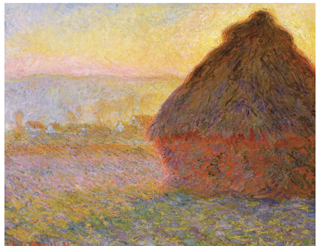
Meule, Soleil couchant Claude Monet