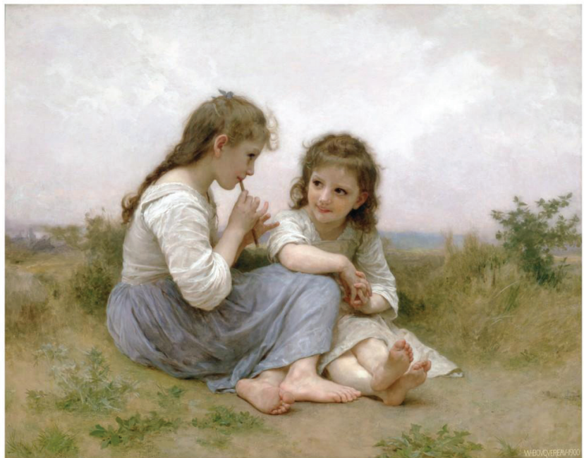
Idylle enfantine, William Bouguereau

- J'ai rêvé que j'étais de retour chez moi. Je me suis réveillé avec l'odeur des crepes de ma mère venant de la cuisine, et je suis descendu les escaliers pour la retrouver en train de danser avec mon père dans le salon, pendant que la pâte dorait dans la poêle. C'est étrange... aujourd'hui, je suis plus âgé que mon père ne l'a jamais été. Mais dans mes rêves, je joue toujours le rôle de l'enfant. On vivait près de la plage quand j'étais gamin, on pouvait voir la mer depuis la fenêtre de la cuisine. Il faisait beau ce jour-là. Après le petit-déjeuner, nous sommes descendus à la plage, et je suis resté allongé longtemps dans le sable, les yeux fermés, à les écouter parler. Puis, après un long silence, je me suis relevé pour voir où ils étaient allés. Je les ai vus, main dans la main, gravissant une dune au bord de la plage. Ils m'ont fait un signe avant de disparaître de l'autre côté.