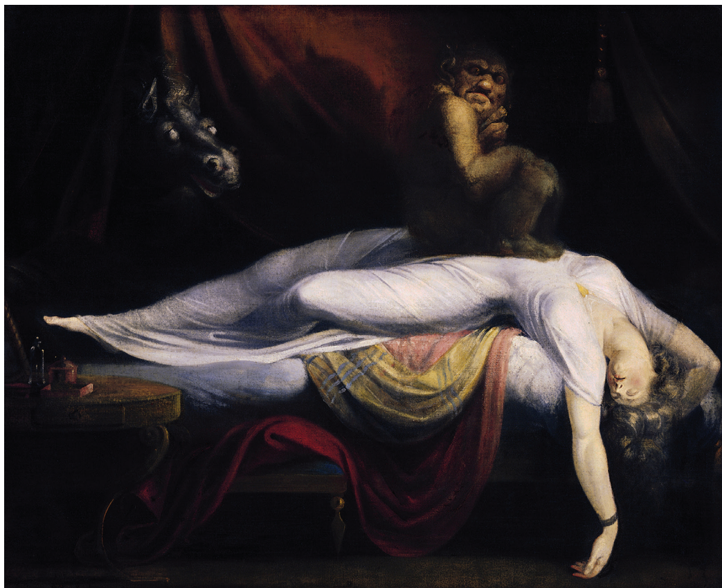
Le Cauchemar, Johan Heinrich Füssli