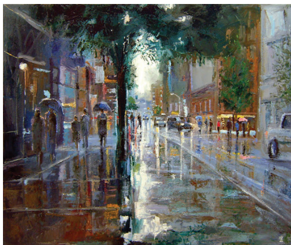
Rain, Dusan Malobabic

Le hall d'entrée était vaste et austère. Le plafond haut, soutenu par des poutres métalliques apparentes, s'ouvrait sur un grand atrium circulaire. Au centre du hall, une immense statue de Robespierre II se dressait sur un piédestal de granit, sa main droite tendue comme s'il pointait vers quelque chose à l'horizon. L'éclairage tamisé des fenêtres en verre dépoli adoucissait les contours rigides de la statue, mais n'effaçait pas sa présence écrasante.